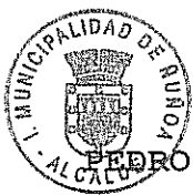
PEDRO SABAT PIETRACAPRINA ALCALDE